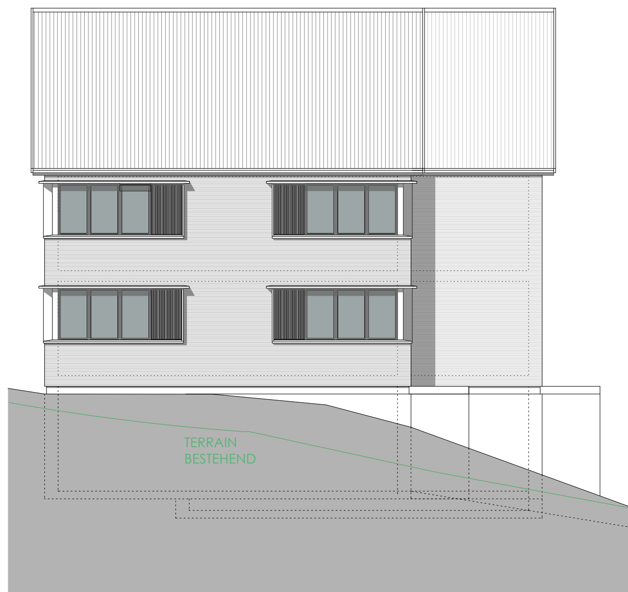
HAUS D HAUS C NORD