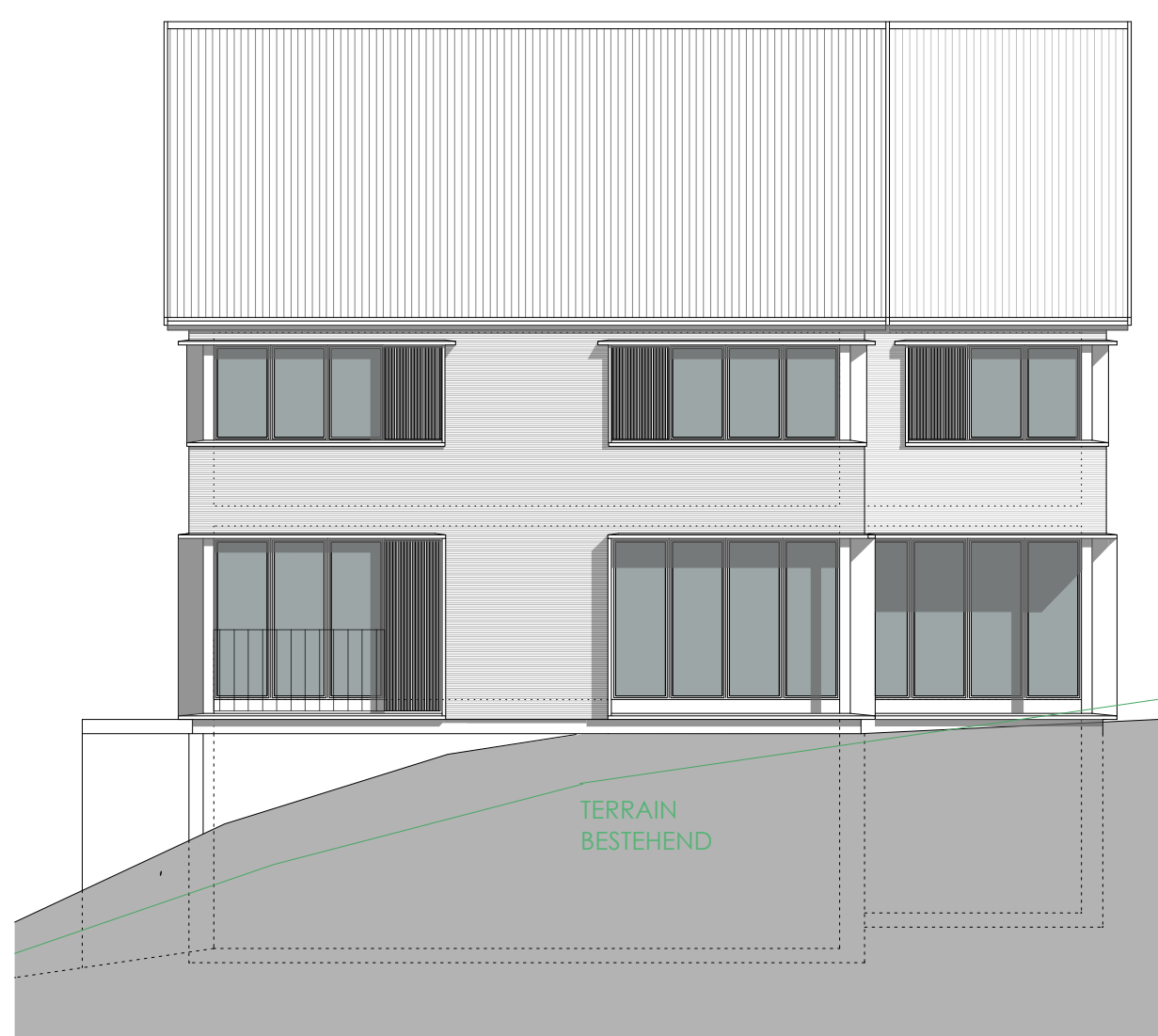
HAUS C HAUS D SÜD