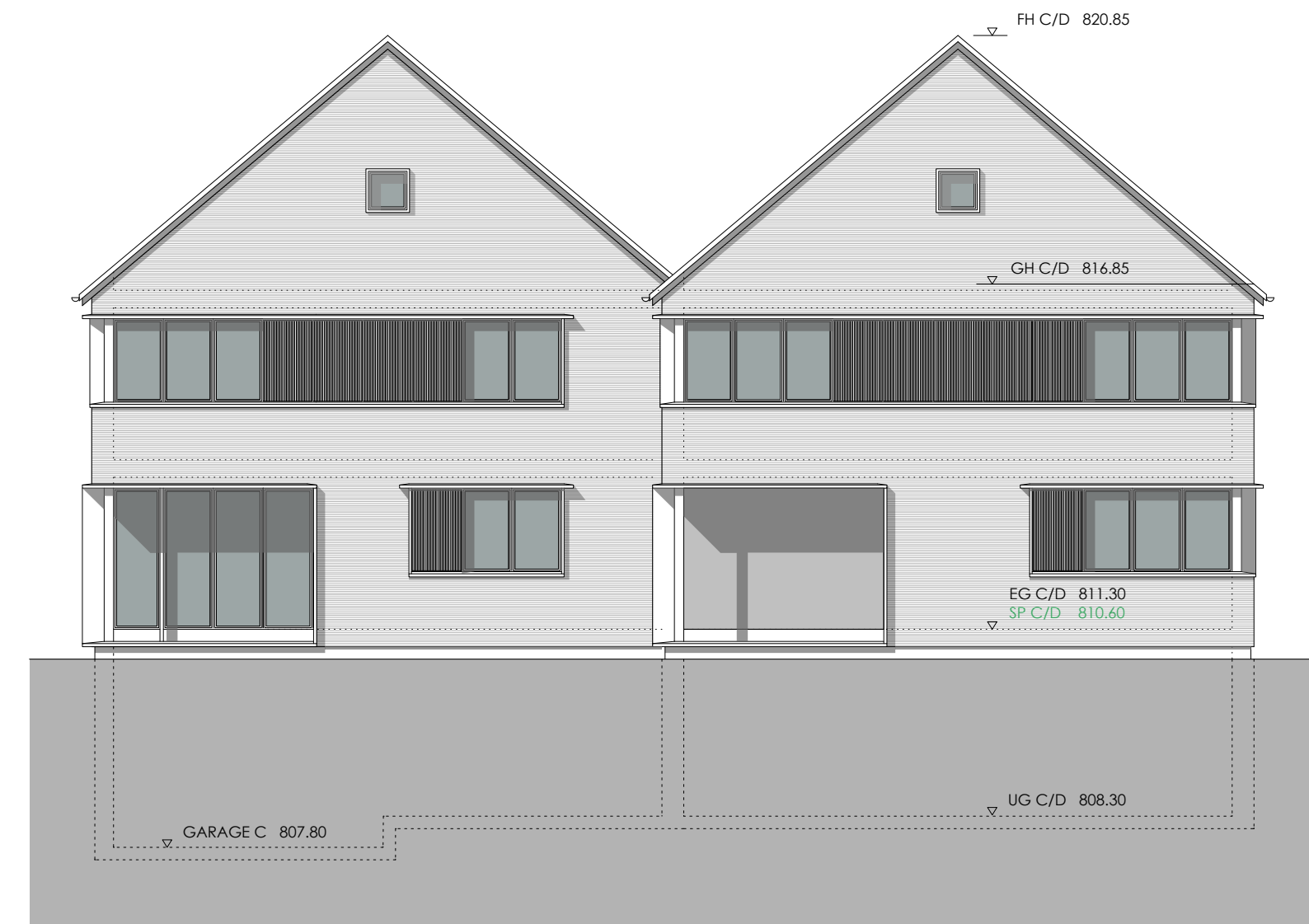
HAUS D HAUS C