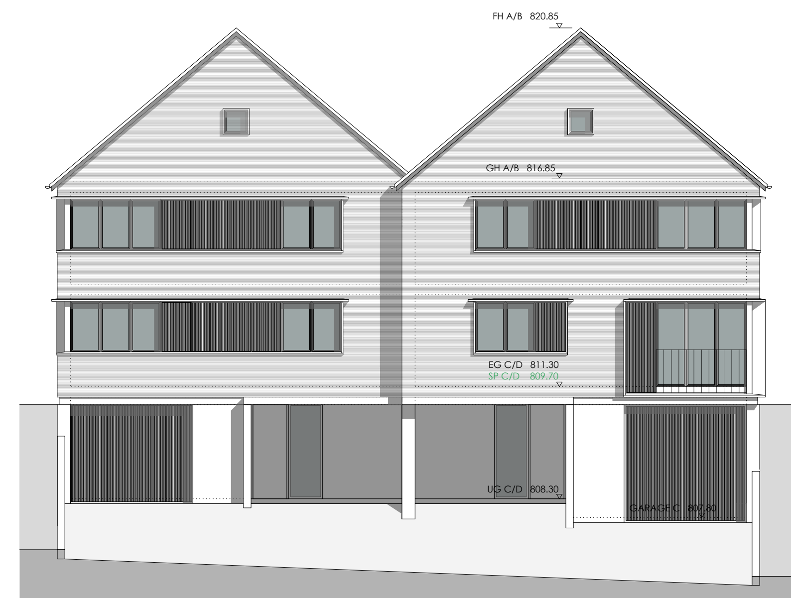
HAUS D HAUS C