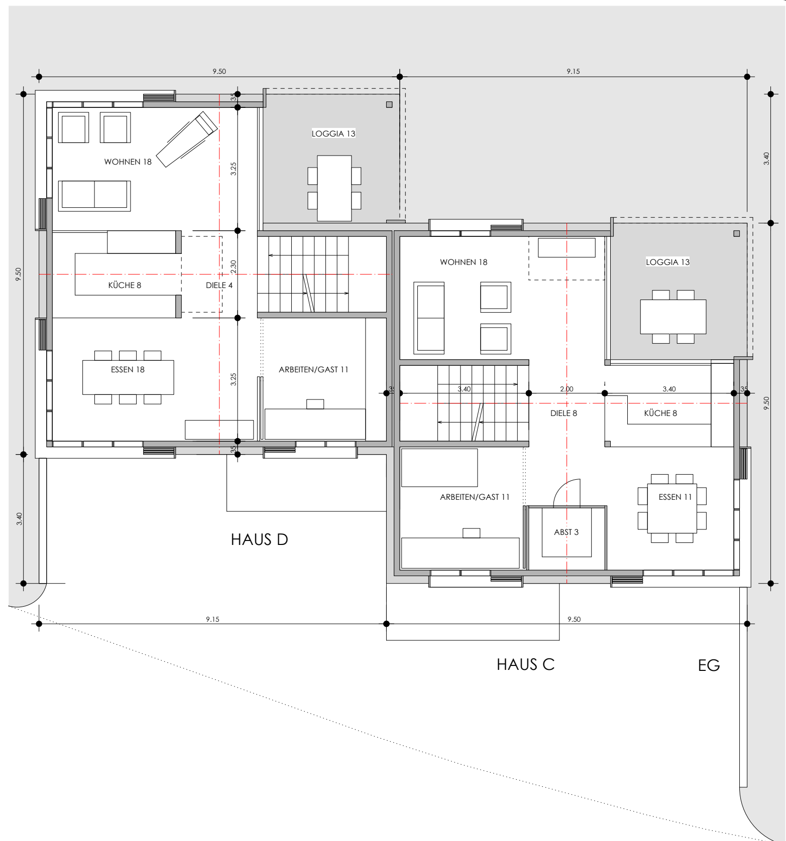
HAUS C HAUS D EG